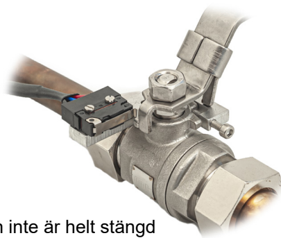
Larmar om ventilen inte är helt stängd

Gränslägesbrytaren kan monteras på två sätt. Indikering på antingen fullt stängd - larm vid öppnande ventil eller fullt öppen ventil - larm vid stängande ventil.